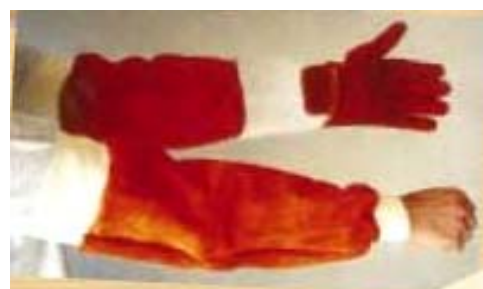
Gants avec manchettes