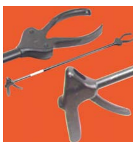
Pince pour chat