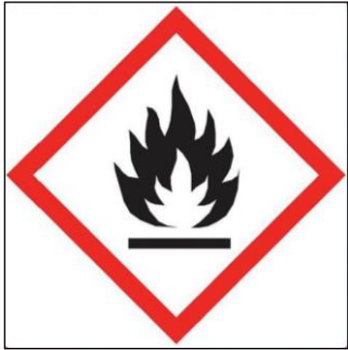
SIGLE n° 2