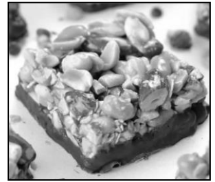
BARRE GOURMANDE CHOCOLAT/CACAHUÈTES