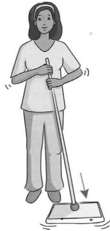
FIGURE n° 2