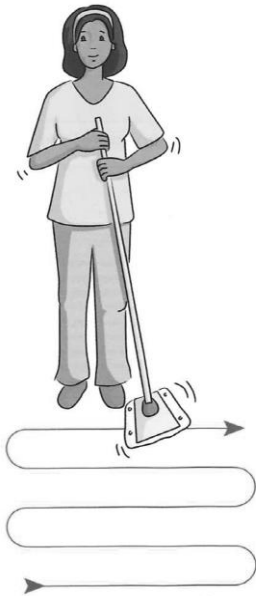
FIGURE n° 1