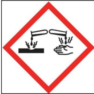
SIGLE n° 3