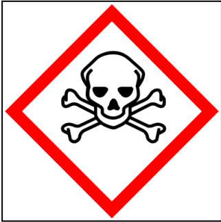
SIGLE n° 1