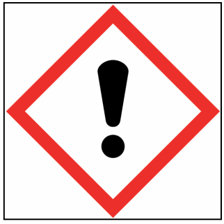
SIGLE n° 4